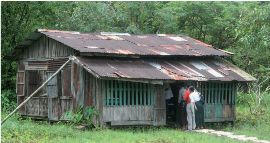
Eine Schule in Myanmar vor und nach dem Umbau